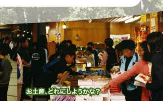
お土産、どれにしようかな?