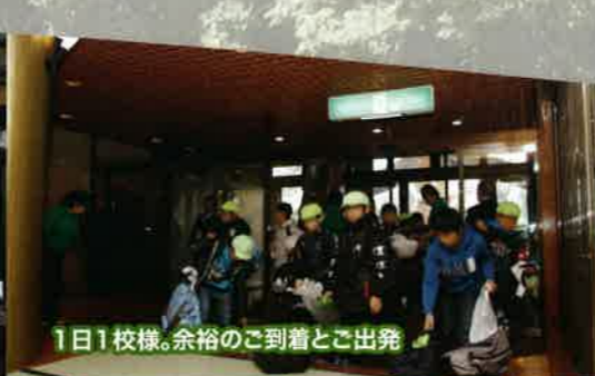
1日1校様。余裕のご到着とご出発