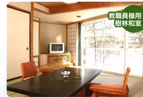
教職員様用樹林和室