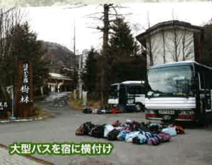
大型バスを宿に横付け