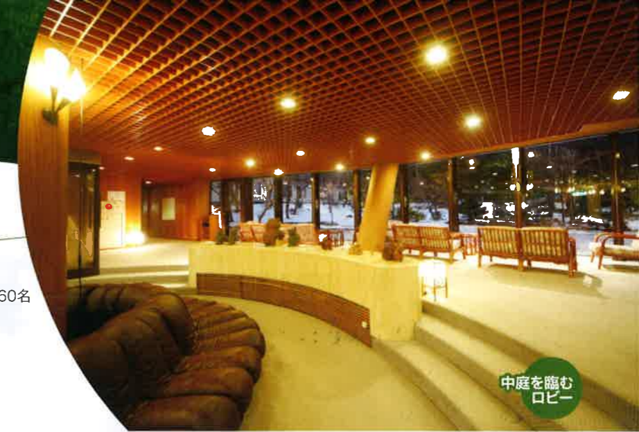
中庭を臨むロビー

5,000坪の樹林の中にたたずむ当館は、春から秋の教育旅行、日光湯元スキー場まで徒歩1分の立地を活かした冬のスキー教室と、大自然が織りなす四季の移ろいの中、児童・生徒様の大切な思い出創りのお手伝いをさせていただきます。