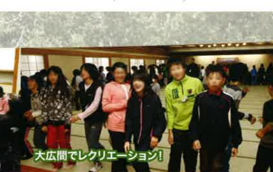
大広間でレクリエーション!