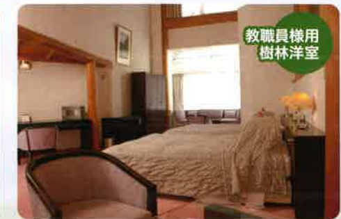
教職員様用樹林洋室