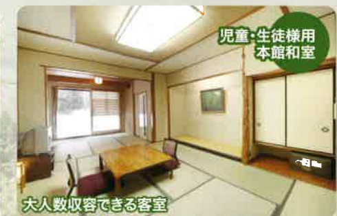
児童・生徒様用本館和室