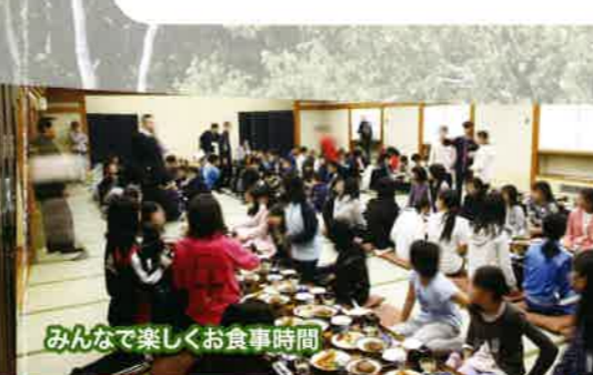
みんなで楽しくお食事時間