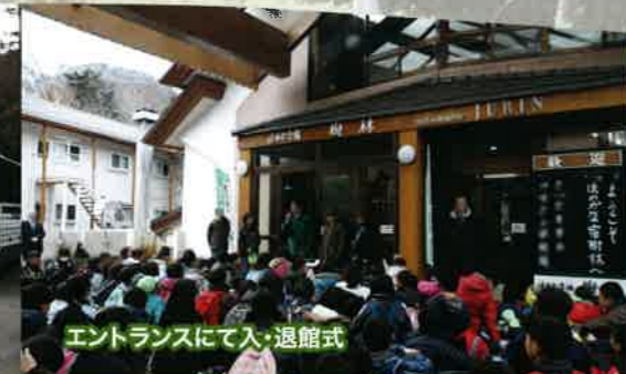
エントランスにて入・退館式